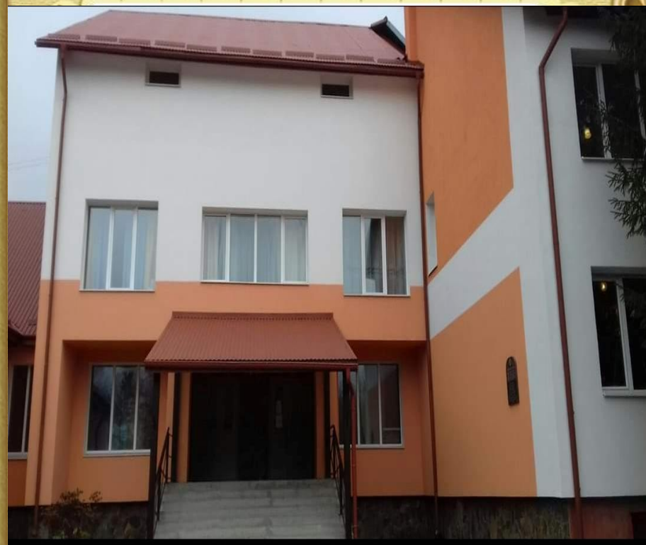
Ясницький ЗЗСО І-ІІІ ступенів імені Памви Беринди